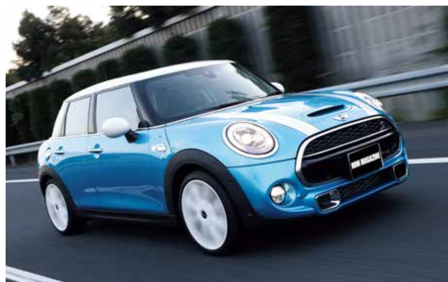
わかりやすく表現するなら1クラス上のクルマへと進化したような安定感溢れるフィーリング。とりわけ高速クルージングでは路面に貼り付く印象が装着前より高まったことで一段とリラックスできるように。

純さなど微塵もなく、むしろ切り始めの自然さや動きの正確さ、切り込んでいった際のトレース性、ステアリングインフォメーションなどすべてがランクアップ。F56より落ち着きのある動きで自在にノーズを変え、挙動がシャープ過ぎないから長距離クルージングでも疲れにくい。まさしく遠方取材などで活用する機会が多いデモカーには最適な特性へと仕上がった。